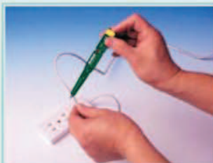
Comprobación de cables cortados