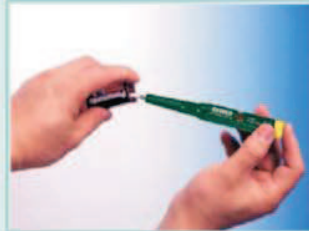
Comprobación de baterías