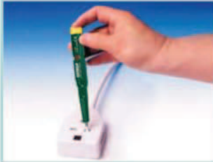
Comprobación de voltaje en enchufes