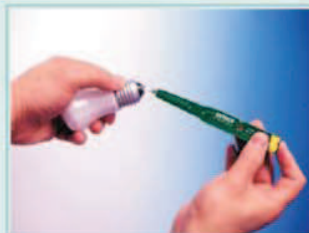
Comprobación de continuidad de una bombilla